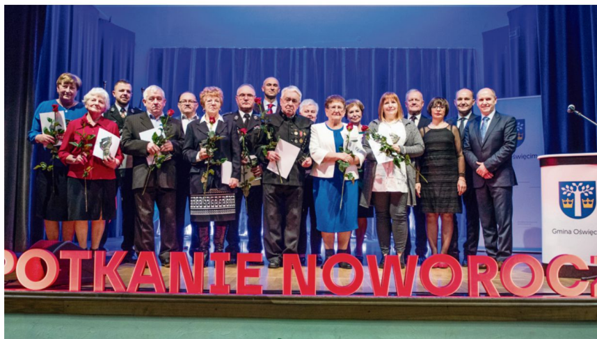
Osoby uhonorowane tytułem „Zasłużony dla Gminy Oświęcim” (lub ich przedstawiciele) odebrały statuetki i dyplomy na spotkaniu noworocznym 26 stycznia.

(Tytuł przyznany na wniosek Sołtysa i Rady Sołectkiej Zaborza.)