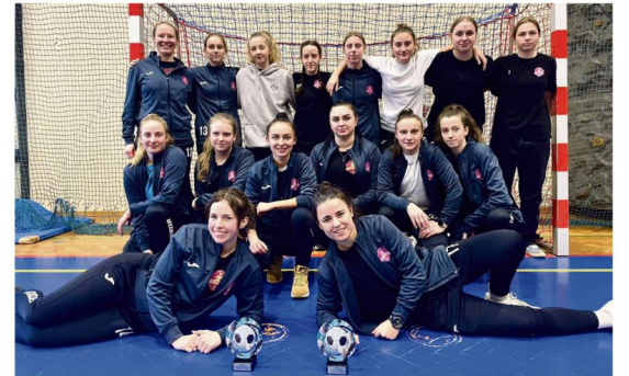
Iskierki wystąpiły w okazjonalnym turnieju halowym w Goczałkowicach-Zdroju.