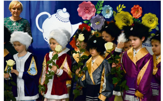
Przedszkole Samorządowe we Włosienicy.