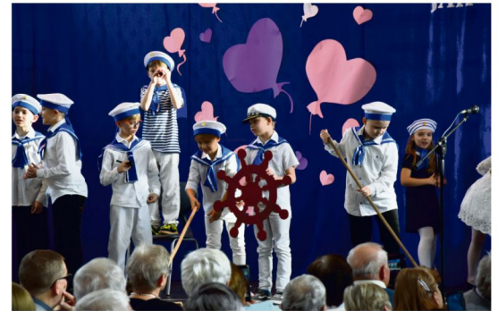
Szkoła Podstawowa w Grojcu.