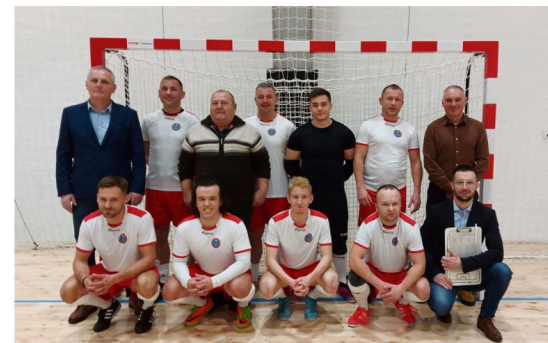
Sędziowie z Podokręgu Piłki Nożnej w Oświęcimiu zdobyli brązowe medale mistrzostw zachodniej Małopolski, a w województwie uplasowali się na czwartej pozycji.