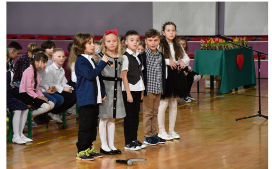
Szkoła Podstawowa w Rajsku.