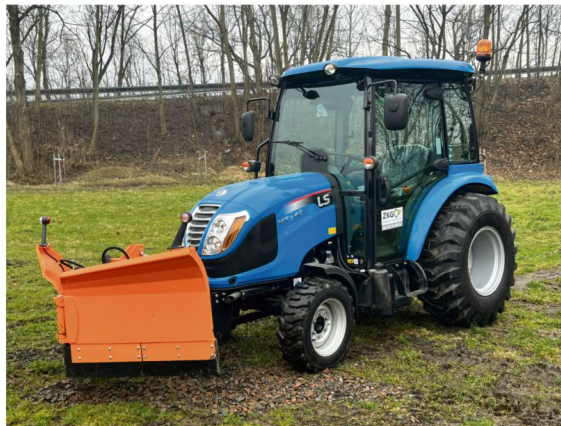
Mini-tractor świetnie nadaje się do pracy w przydomowych warunkach.

Sentyment czasem nie pozwala pozbyć się starych drzew. Żal leciwej jabłonki, bo przecież zasadził ją jeszcze dziadek. Tymczasem właściwe utrzymanie roślin również wymaga specjalistycznej wiedzy i profesjonalnego sprzętu. Nie każdy właściciel działki nimi dysponuje, warto więc wziąć pod uwagę pomoc doświadczonych fachowców.