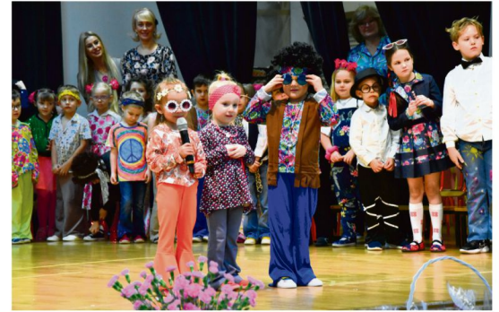
Przedszkole Samorządowe w Grojcu.