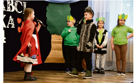
Szkoła Podstawowa w Porębie Wielkiej.